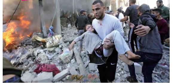
ガザ大虐殺での死者は 30000 人を超えた