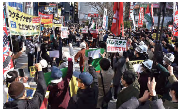
大結集したウクライナ戦争2周年の新宿デモ