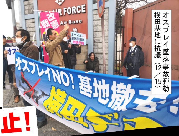
オスプレイ墜落事故弾効 横田基地に抗議(12/15)