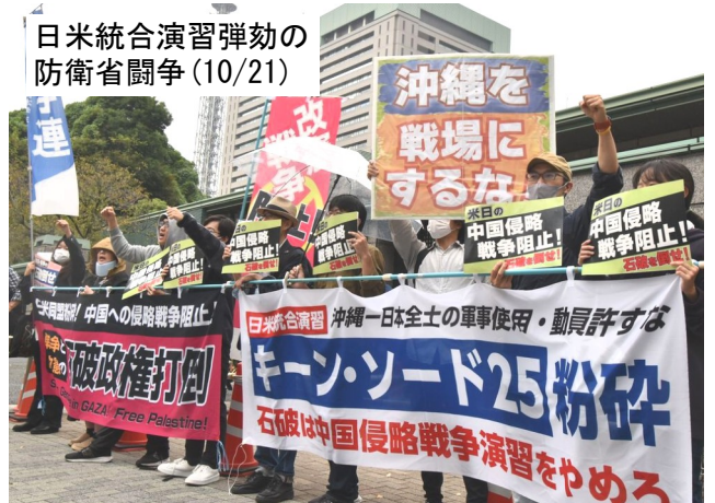
日米統合演習弾劾の防衛省闘争(10/21)

●25年度は、中国本土を射程に入れる1000km超の長射程ミサイル配備、海自艦への巡航ミサイル・トマホーク搭載も狙われています。中国侵略戦争阻止の大決戦です。石破・トランプ倒せ! 中国侵略戦争のための「統合作戦司令部」発足許すな! 3・21防衛省闘争に集まろう。