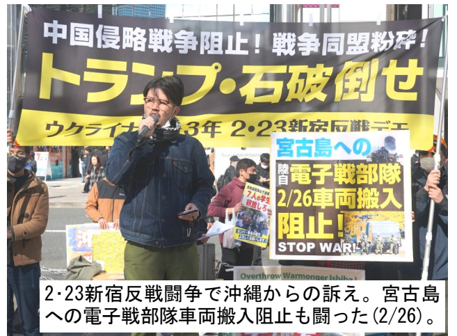
2・23新宿反戦闘争で沖縄からの訴え。宮古島への電子戦部隊車両搬入阻止も闘った(2/26)。