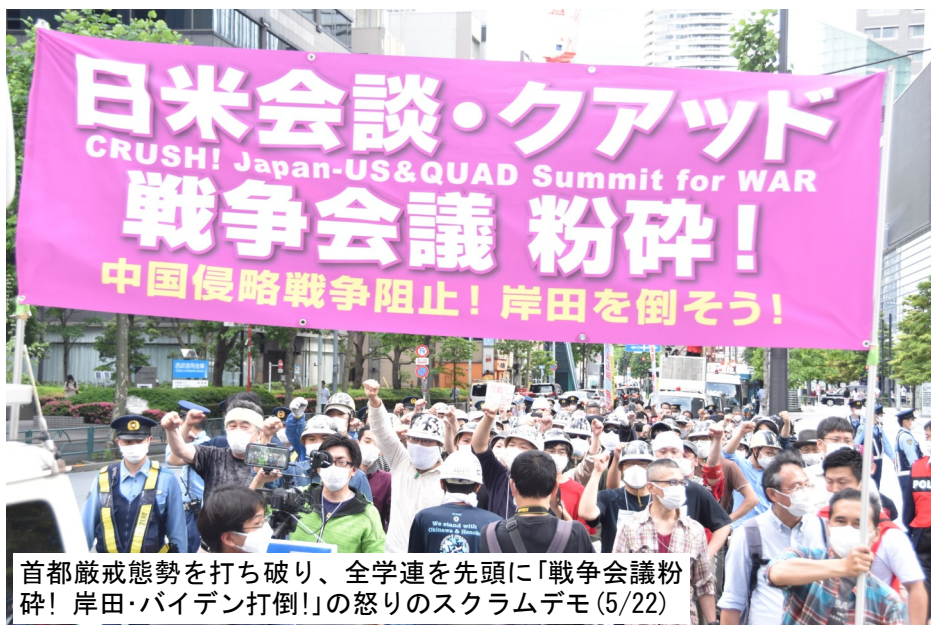
首都厳戒態勢を打ち破り、全学連を先頭に「戦争会議粉碎! 岸田・バイデン打倒!」の怒りのスクラムデモ(5/22)

6月29~30日のNATO首脳会議に、岸田が日本の首相として初めて出席しようとしています。ウクライナ戦争への参戦国としての登場を絶対に許さない!