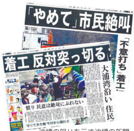
沖縄の怒りを示す沖縄の新聞 (1/11 付沖縄タイムス)

●全国で ミサイル避難訓練 という名の戦争訓練が、全国で強行されています。中国や北朝鮮への敵意をあおり、私たちを戦争に駆り立てるための訓練です。絶対反対しよう。