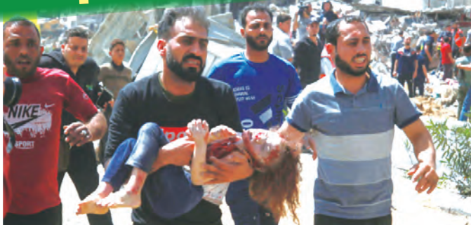
ガザの死者は 25000 人を超え、1 万人以上の子どもたちが殺された