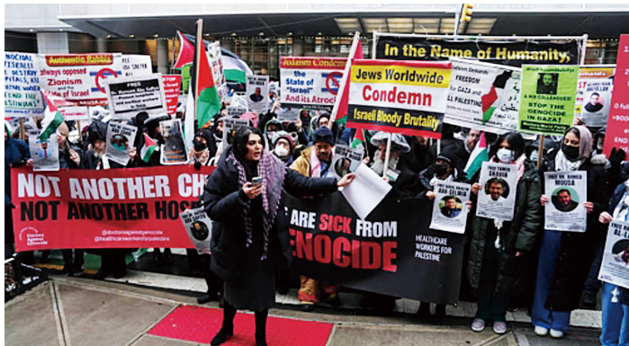
医療労働者がガザでの病院襲撃に抗議【1月6日 ニューヨーク】

国の脅威」を煽り、中国の体制を転覆する侵略戦争（＝世界戦争・核戦争）に突き進んでいます。石破政権は、日本を「台湾防衛の要」と位置付けるアメリカとともに、8兆7,005億円の「中国侵略戦争予算」とも言うべき大軍拡予算を組みました。核心は、沖縄・南西諸島のミサイル基地化です。