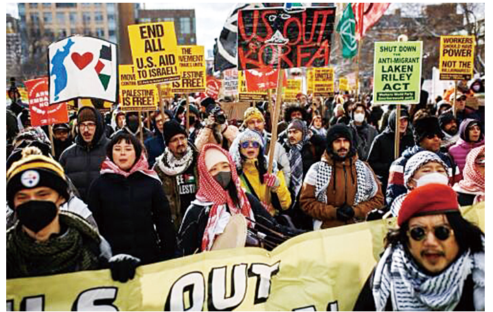
トランプ就任式に全米で怒り爆発「イスラエルへの支援をやめろ」「朝鮮半島から手を引け」。パレスチナ人民との連帯を示すクーフィーヤを巻き、トランプの就任式に抗議するデモ隊【1月20日 ニューヨーク】

1908年3月8日、ニューヨークで女性縫製工らが、劣悪な労働環境、長時間労働、低賃金に怒り、参政権を求めてデモに立ち上がりました。その数15000人。この日を記念して1910年に国際社会主義婦人会議が、3月8日を国際婦人デーとすることを決め、1911年から世界中で闘い継がれています。1917年、ロシアの3・8国際婦人デーは、女性たちが「パンと平和」を求めるデモとストライキに立ち上がりました。この闘いは瞬く間に広がり、帝政を打倒し、戦争を終わらせる革命の口火を切りました。国連は70年代に世界で爆発した女性解放闘争を資本主義の体制内に取り込むために、1975年国際婦人年を制定し「国際女性デー」としてその意義を解体しようとしています。ロシア革命を切り開いた3・8国際婦人デーを女性たちの「闘いの日」として甦らせよう。