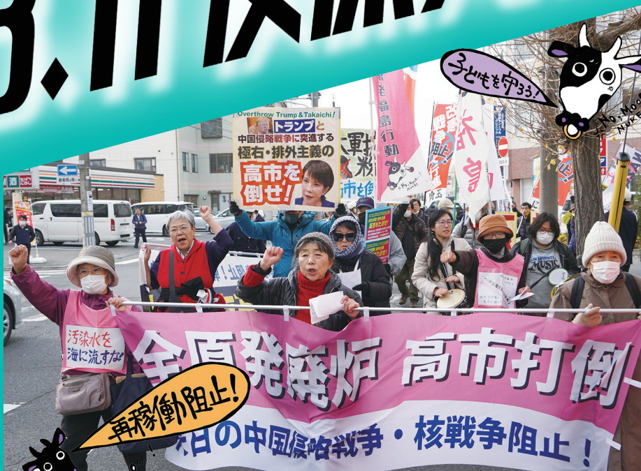
高市首相の福島訪問を弾劾するデモ (25年12/2 福島市)