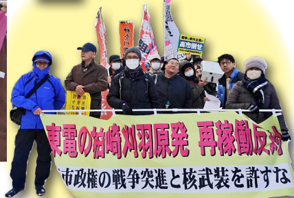
柏崎刈羽原発の再稼働反対のデモ (1/25 新潟市)

新潟・柏崎刈羽原発で再稼働中に重大なトラブルが発覚し、緊急停止! 第二の福島事故が切迫している。東電に原発を動かす資格はない。今こそ原発なくせの声を!