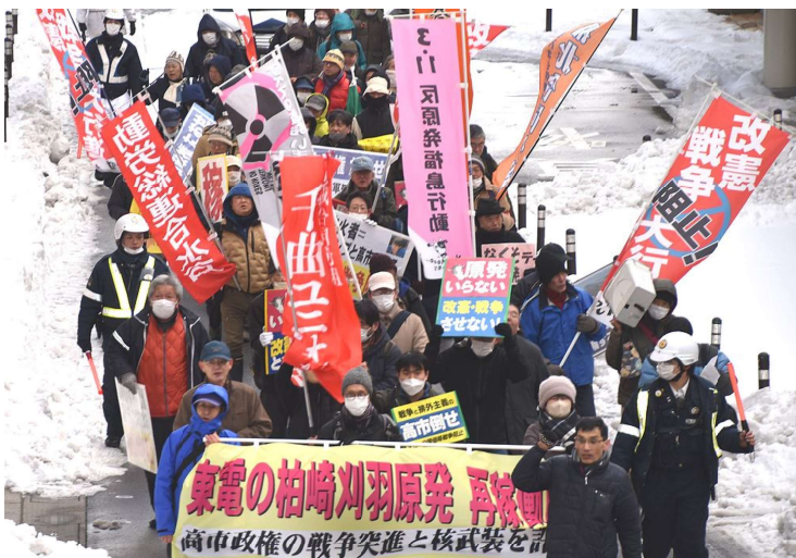
豪雪の新潟で柏崎刈羽再稼働阻止のデモ(1・25新潟市内)

高市独裁クーデターの改憲・戦争・核武装を許さない！ 今こそ翼賛国会のりこえ大衆的実力で核と戦争阻止しよう。怒り、闘う世界の民衆と共に帝国主義倒そう！